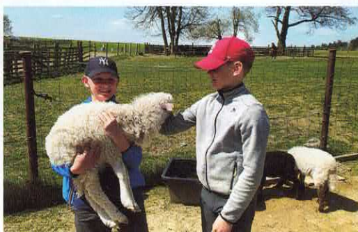
Nedělní škola řemesel ve Stránském uspořádala vítání mláďat