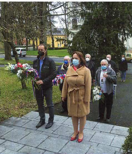
Vedení města i občané uctili památku padlých osvoboditelů