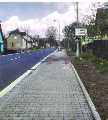
V Janovicích se začne budovat stezka pro pěší a cyklisty