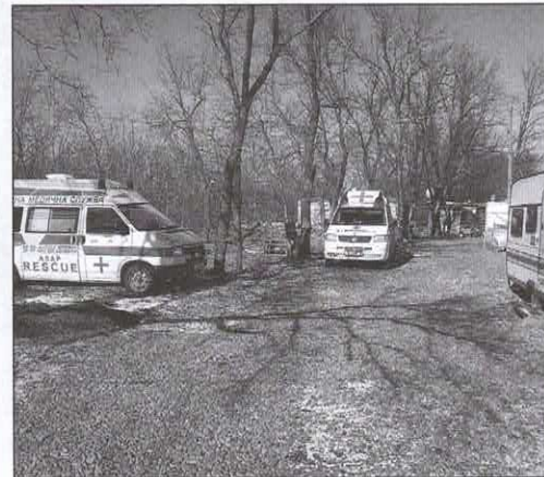
Improvizované sídlo zdravotnické záchrané služby