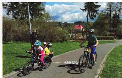
V závodě po Jesenické magistrále letos cyklisté soutěžili online