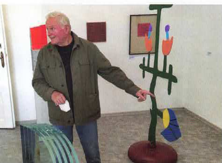
Městské muzeum zahájilo činnost výstavou Duch hmoty