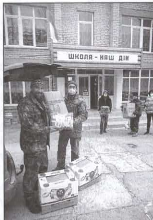
Při předávání materiálu u školy v Opytne